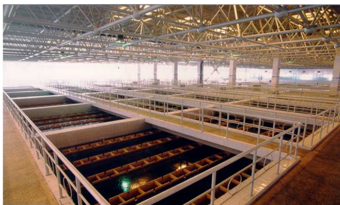
EQUIFLUX® intégré dans un bâtiment

La conception des goulottes favorise l'équi-répartition.